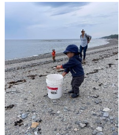
Concours photo du 5 juin 2021

J'espère que vous serez nombreux à vous joindre à nous dès 9 h à la halte routière (en face de l'église).