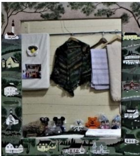
Di Ferrabee –miroir