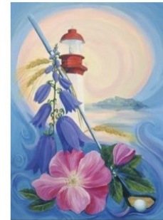
Ville de Métis-sur-Mer