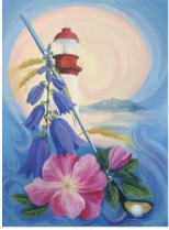
Ville de Métis-sur-Mer

Métis aura 200 ans en 2018. Aimeriez-vous vous impliquer dans le comité qui organisera des événements et célébrations pour souligner cet anniversaire? Concerts, expositions, feux de joie, Cabaret, golf en costume d'époque, marathon maritime, conte au phare, Métis en fête, fête nationale, etc... Ce sont quelques-unes des activités possiblement choisies et organisées par le comité et les groupes communautaires de Métis.